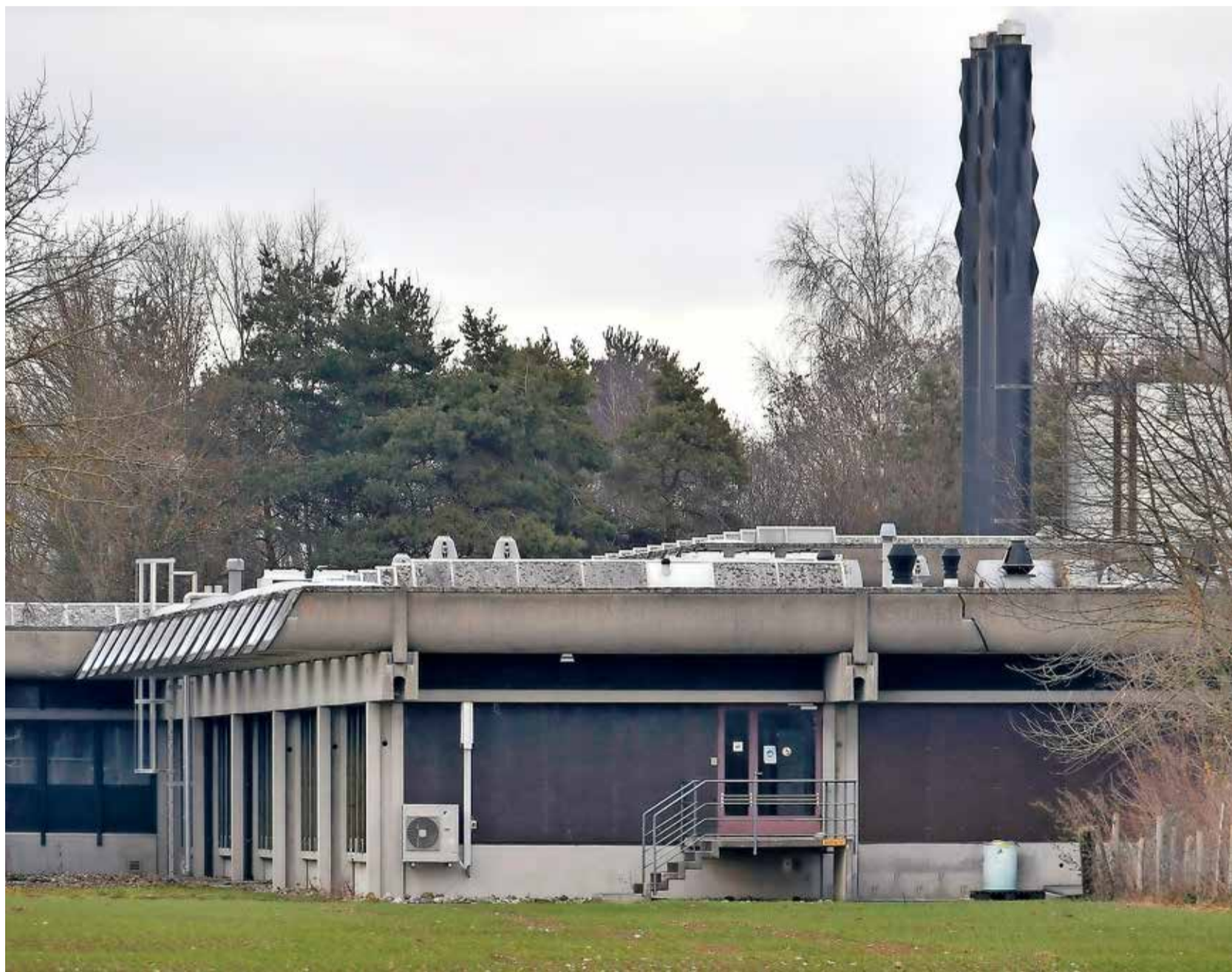
Le Gouvernement fribourgeois compte faire de ces zones de Saint-Aubin (photo) et de Marly les outils de sa politique foncière.

ÉCONOMIE Pour 20 millions de francs, l'Etat de Fribourg veut racheter les terrains et locaux de l'entreprise Elanco. Le gouvernement souhaite faire de ces vastes