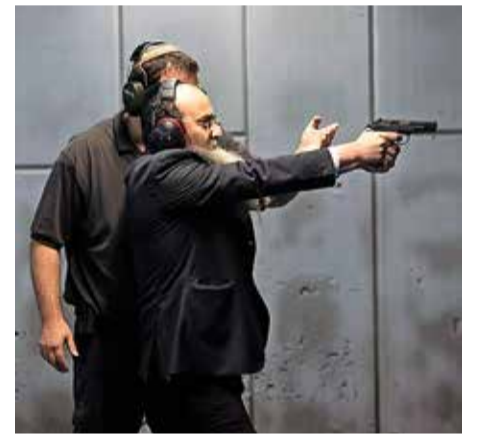
Le tir a toujours plus d'adeptes.